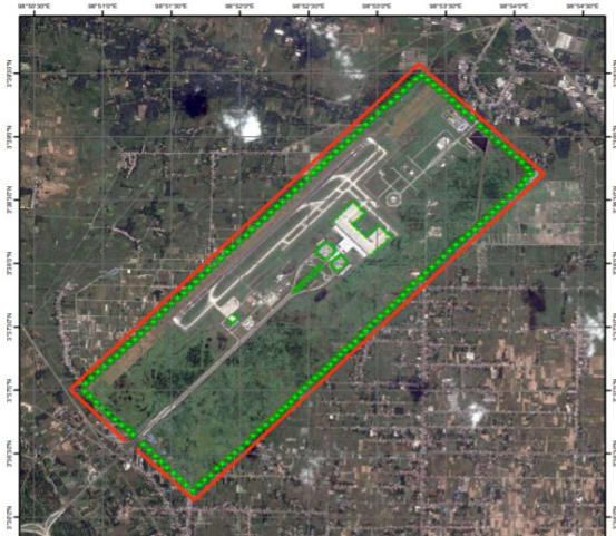
Gambar 3. Bentuk Rencana Barrier yang Direncanakan, (merah adalah tembok batu bata diplester dan hijau adalah tanaman perdu)