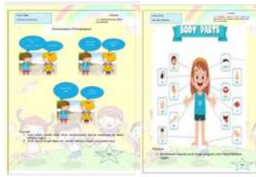
Gambar 6 Desain LKA Identitasku dan Tubuhku