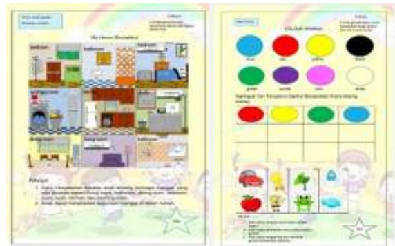
Gambar 7 Desain LKA Rumahku dan Warna