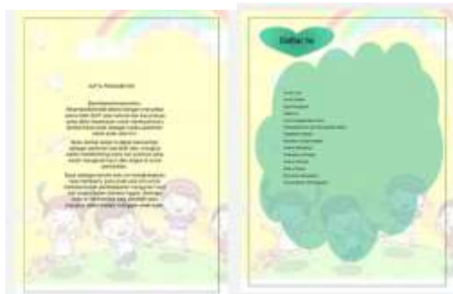
Gambar 3 Desain Kata Pengantar dan Daftar Isi