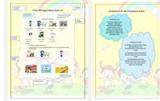
Gambar 4 Desain Petunjuk Penggunaan Buku dan KI & KD