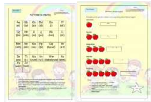
Gambar 5 Desain LKA Abjad dan Bilangan

Hasil penelitian menunjukkan bahwa adanya revisi materi sesuai dengan saran validator yaitu mempertahankan huruf pada halaman 6-31 dan menambahkan konsep bilangan pada halaman 5. Agar bahasa LKA valid perlu disesuaikan pada anak usia dini dengan menggunakan ejaan yang baik, sederhana dan mudah dimengerti, serta tidak memiliki makna ganda. Hal ini dapat dipahami oleh anak usia dini ketika peneliti menggunakan bahasa untuk mengajarkan kosakata bahasa Inggris melalui kalimat sederhana. Berdasarkan validator media, sebaiknya peneliti menggunakan gambar animasi untuk membuat gambar pada LKA. Respon anak terhadap soal LKA dapat dipengaruhi oleh animasi gambar. Berikut desain produk yang peneliti perbaiki berdasarkan saran dan komentar validatornya: