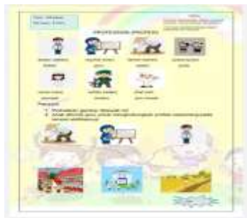
Gambar 9 Desain LKA Profesi

Peneliti kemudian mengerjakan uji coba pada anak kelas B3 TK Matahari Palembang melalui kegiatan begitu menyenangkan seperti menggunting dan menempel yang membuat anak tertarik dan tidak bosan. Uji coba dikerjakan dalam dua tahap, yakni uji coba individu dan uji coba kelompok kecil.