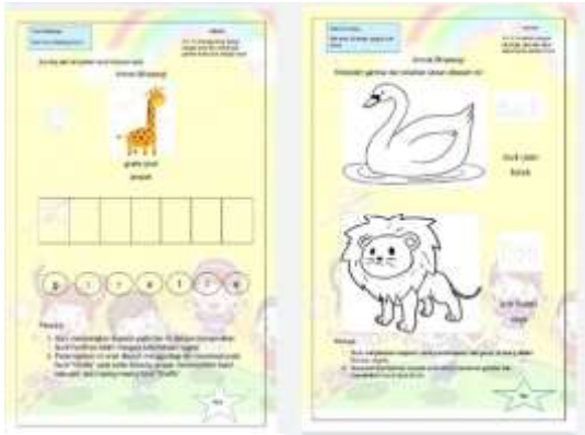
Gambar 8 Desain LKA Hewan