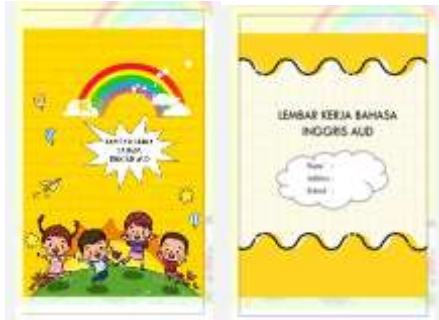
Gambar 2 Desain Cover Luar dan Dalam LKA